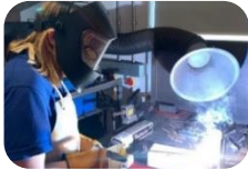
Weldio a Pheirianneg

ddarpariaeth sgiliau i gyflogwyr yn y sir. Yn ogystal â gweithio'n agos gydag ysgolion wrth ddarparu cyrsiau galwedigaethol a chwricwlwm amgen, mae HCT yn cyflwyno rhaglenni Hyfforddeiaethau, Prentisiaethau a Dysgu Seiliedig ar Waith ar ran Llywodraeth Cymru, ar hyn o bryd trwy gytundebau wedi eu his-gontractio gydag ACT Ltd. Mae HCT hefyd yn darparu hyfforddiant ar sail fasnachol i'r gymuned ehangach ar draws meysydd galwedigaethol amrywiol. Mae HCT wedi bod yn chwarae rhan weithredol wrth ddarparu dysgu seiliedig ar waith yng Ngheredigion ers dros 30 mlynedd. Mae HCT yn cynnig ystod o gyrsiau galwedigaethol sy'n paratoi pobl ar gyfer y gweithle trwy ddarparu hyfforddiant sgiliau yn y pynciau canlynol: