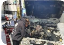
Cynnal a Chadw Cerbydau